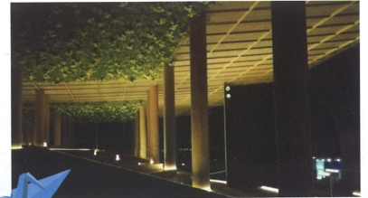
おりづるタワー展望台より